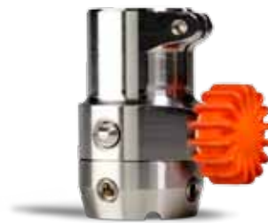
Posición de bloqueo